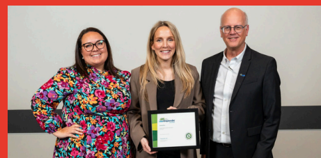
Vannie & Co Catégorie Commerce