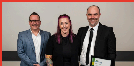
Confiserie moderne Okashi Pop Prix Flexipreneur