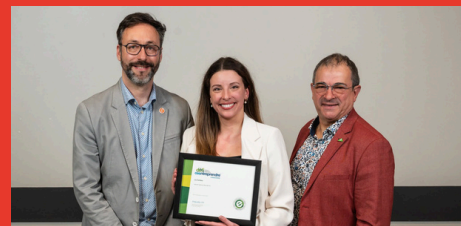
Les Farfelus Prix Réussite inc.