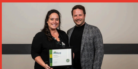
Synergie Notariale Catégorie Services aux entreprises